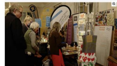
30 soziale Projekte stellen sich beim 'Giving Tuesday' in München vor.